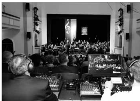
PKF – Prague Philharmonia

Sonáta B. Martinů, složená v roce 1954 v Nice. Může Martinů ještě nepřekvapit? Nemůže. Zdálo se, že vše plyne v rozmanité hudebnosti dál, když tu, uprostřed druhé věty, jsou slyšet kulhavé pří-