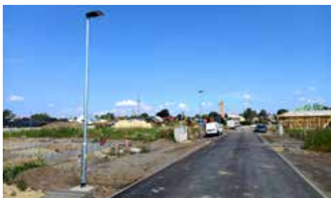
Lokalita Jih I

Infrastruktura I. etapy lokality Jih I – do konce července dokončeny komunikace z asfaltbetonu, hrubé terénní úpravy a sjezdy na pozemky v podkladních vrstvách. Dokončení dlážděných zpevněných ploch se předpokládá do konce roku 2026. Ostatní stavební objekty (vodovod, kanalizace, plynovod, elektrické kabelové rozvody, optické rozvody a VO) jsou již hotové. Jedná se o zasíťování 21 pozemků pro následnou výstavbu RD. Stavbu provádí společnost PKS stavby, a.s. Žďár n. Sázavou a cena realizace činí cca 22,5 mil. Kč (část stavby, kde je investor město), cena vodovodu činí cca 3 mil. Kč vč. DPH (investor Svazek obcí Vodovody Poličsko).