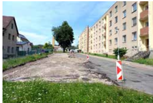
Parkoviště u domů 899–903

Stavební úpravy komunikací u bytového domu čp. 899-903 na ul. Hegerova – jedná se zejména o rekonstrukci parkovišť a komunikace (povrch parkovišť bude z vegetační dlažby, povrch komunikace bude z asfaltbetonu). Stavbu provádí společnost APOLO CZ, s.r.o., cena realizace činí 5,6 mil. Kč.