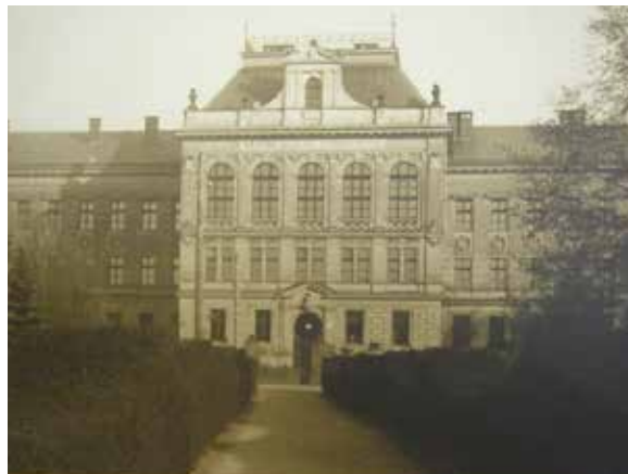
Budova školy před sejmutím nápisu. Dobře patrná je také brána vedoucí na pozemek gymnázia.

Od počátku školního roku 1941–1942 již nebyly otevřeny tři třídy gymnázia, tím začalo jeho postupné rušení. Osud národa se měl postupně naplnit. K této devastaci školství časem přistoupilo ještě nucené nasazení práce schopných ročníků mladých lidí do tovární válečné výroby v Říši. I tady pracovaly protektorátní úřady efektivně a nemilosrdně. Zkoušky dospělosti se v letním období na ústavě nekonaly, neboť 20 žáků z celkového počtu 22 bylo dne 29. března 1943 povoláno k pracovní povinnosti, tito žáci obdrželi vysvědčení na odchodnou a potvrzení od úřadu práce, že svědomitě konali své povinnosti, byla jim na vysvědčení na odchodnou připojena poznámka, podle které jsou pokládáni za dospělé. Zbývající dva žáci podrobili