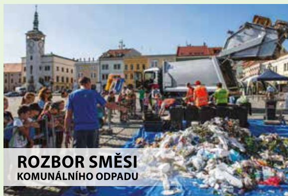
ROZBOR SMĚSI KOMUNÁLNÍHO ODPADU

Věříme, že tato akce bude pro nás výzvou ke zlepšení třídění, které nejen že přispívá k ochraně životního prostředí, ale znamená i úsporu nákladů za skládkovné a příjem odměny od společnosti EKO-KOM, a.s. do rozpočtu města.