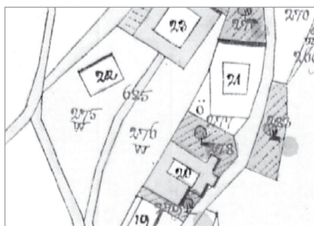
Detail situace usedlosti s popisným číslem 22 v Lezníku na mapě stabilního katastru z roku 1839 (Ústřední archiv zeměměřičství a katastru, zveřejněno na http://archivnimapy.cuzk.cz/ )

Usedlost s popisným číslem 22, která byla předmětem našeho zájmu, má v tomto systému v Lez-