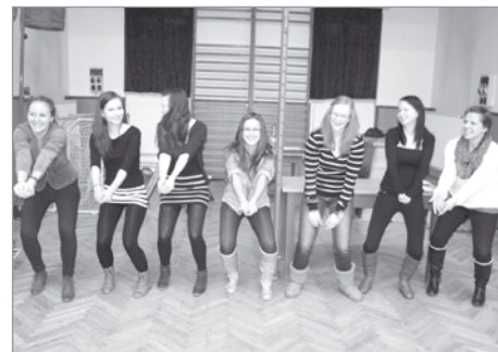
Volejbalové juniorky předvádějí bagr