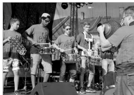
Jsem bubeník a kdo je více? – Bubeníci