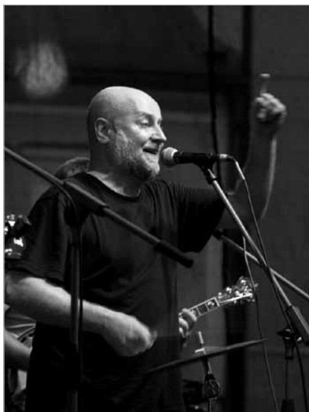
Svizň Děda Mládek Ilegal Band