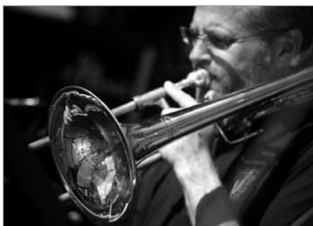
Celé náměstí v pozounu – JK Band Pardubice