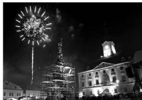
21 hodin a 36 minut