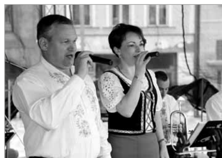
Milá řeč moravská a milý zpěv moravský – Cyrilka