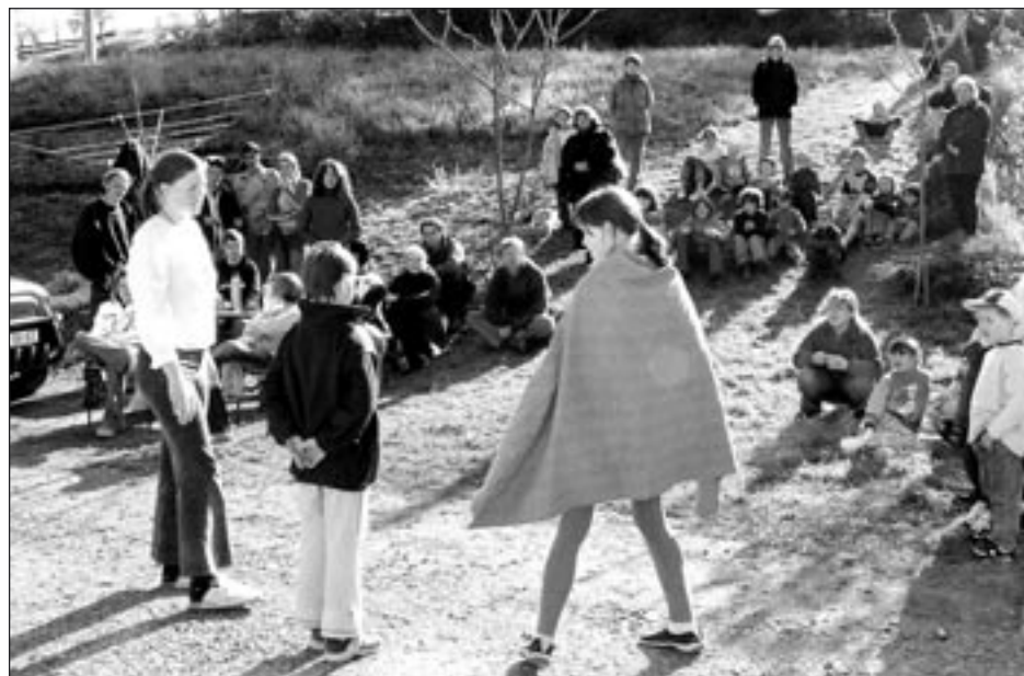
Malé divadelní představení sledovalo mnoho diváků.