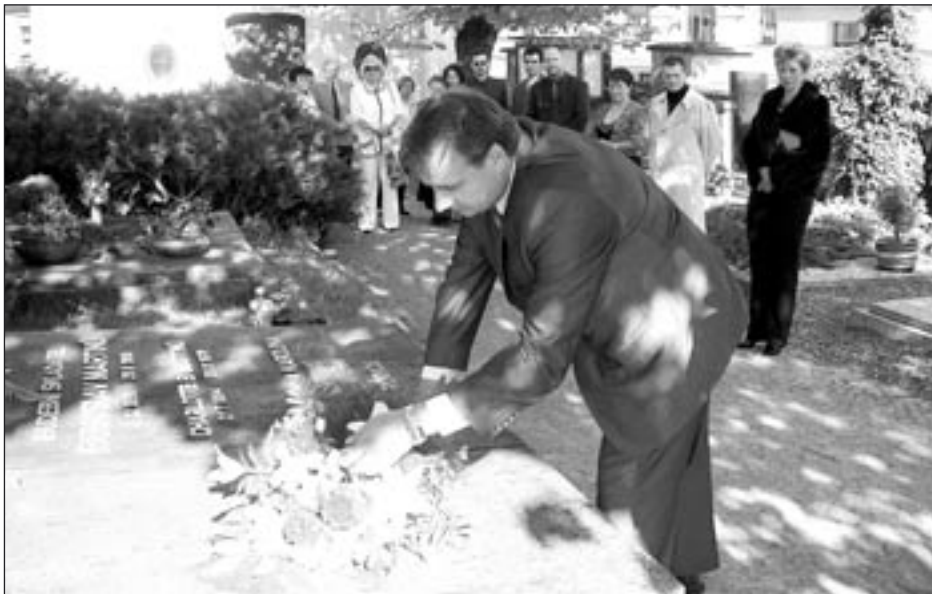
Každoročně se před zahájením Martinů festu koná pietní akt u hrobu Bohuslava Martinů.