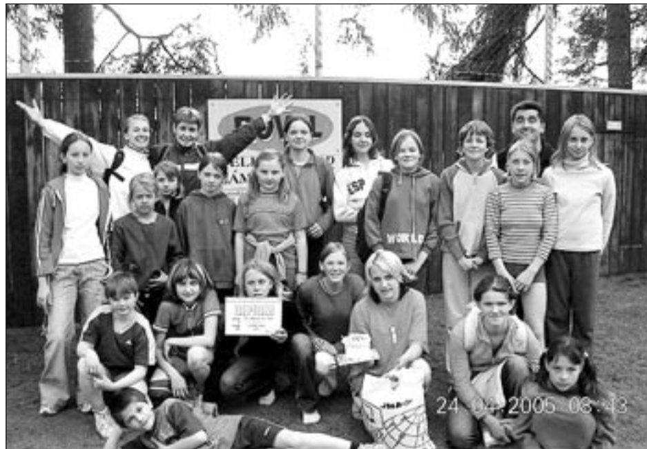
Na prvním venkovním turnaji si všichni účastníci dobře zabrali.