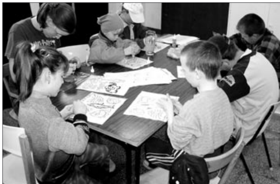
Při otevření klubu si děti mohly vyzkoušet malování obrázků na sklo.

Nízkoprahový klub na vesnici je zatím první vlastovka. Jeho programová náplň bude do značné míry záviset na aktivitě místních obyvatel. Rýsuje se kroužek keramiky, připojení na internet, divadelní a turistický kroužek, tréninky ve stolním tenisu. Pokud budou mít zájem ženy na mateřské dovolené, mohly by se scházet dopoledne v mateřském klubu. „Chceme, aby tento prostor sloužil všem obyvatelům Stříteže jako komunitní centrum, jako místo setkávání v přísně nekuřáckém prostředí,“ řekl při rozloučení Ivan Šrek.