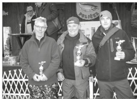
Vítězové jedné z kategorií