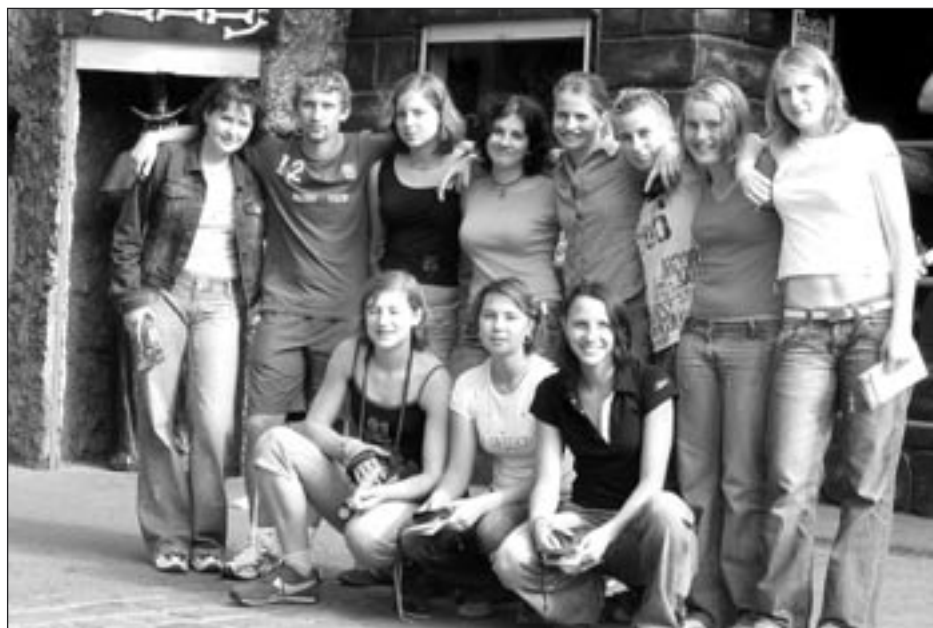
Společně ve vídeňském Prátru

Dotaci bude možno čerpat i v průběhu roku 2006, protože město Hlinsko chce peníze využít účelně dle aktuálních potřeb členů rodiny. Rozhodnutí rady ještě musí potvrdit krajské zastupitelstvo, které se sejde na konci října.