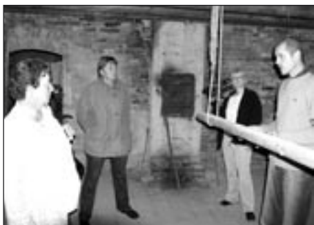
Úpravy čekají i prostory v prvním patře statku.

Koncem září podepsali zástupci měst Moravská Třebová, Litomyšle, Svitav a Poličky, společně se starostou obce Květná, prohlášení o partnerství s občanským sdružením Květná zahrada. Prohlášení deklaruje a ošetřuje spolupráci uvedených měst a obce s občanským sdružením Květná zahrada, jehož náplní je zajištění ubytování a nabídky zemědělských prací a pomoci při chovu zvířat až 15 mlá-