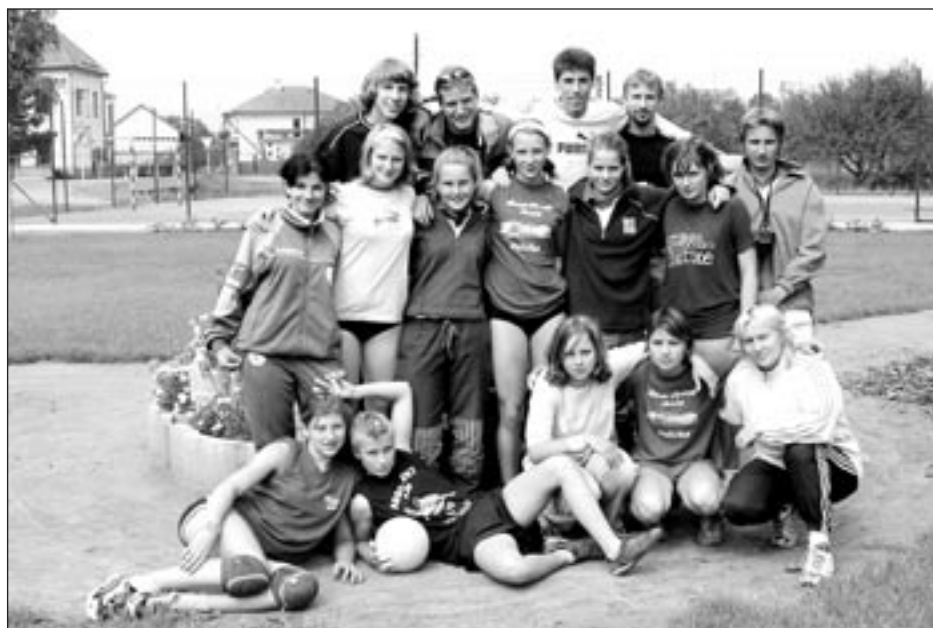
Čestice - kadetky a jejich tréninkoví spolubrátri

25. září jsme odjely na náš druhý přípravný turnaj, jehož pořadatelem byl Sokol Dolní Újezd. Počítalo se s účastí čtyř družstev, ale po odřeknutí Chocně se turnaje zúčastnila pouze družstva Dolního Újezda, Litomyšle a Poličky. Hrál se na tři vítězné sety a my jsme si mohly pochválit naši poctivou tréninkovou přípravu, která se zúročila v našem jednoznačném vítězství. Vy-