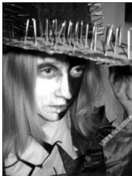
Původní návrh Jekylla a Hyda