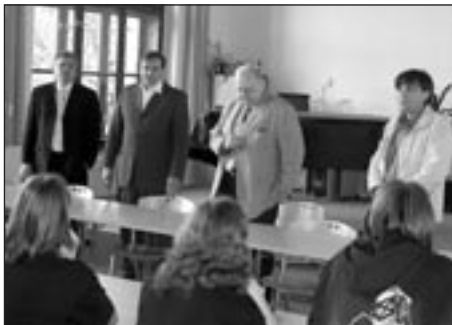
Fotografie je ze setkání se studenty.