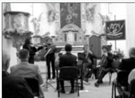
Večer pak koncertovalo Collegium 1704 v chrámu sv. Michala. Potenciální účastníci jako by si vybrali oddechový čas a brálo se jen pro nejevěrnější posluchače.