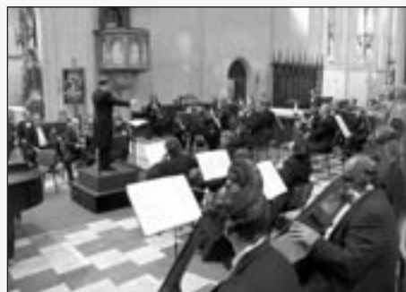
Ten koncertoval pod taktovkou R. Montenegro z Uruguaye a jako sólisté vystoupili členové Smetanova tria.