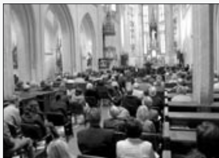
Účastí pořamocenu pověst letošního festivalu poličští trochu napravili při závěrečném koncertu Českého národního symfonického orchestru v chrámu sv. Jakuba.