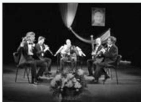
Pražské dechové kvinteto na tom nebylo s účastí o mnoho lépe a diváci by se vešli do Malého sálu. Výkony orchestru byly vynikající a publikum také.