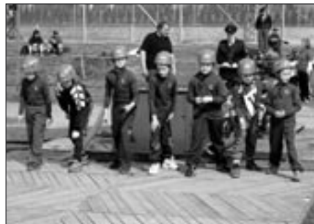
Družstvo mladších žáků na startu požárního útoku