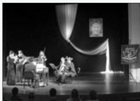
Pražský barokní orchestr Collegium 1704 dopoledne koncertoval v Tylově domě pro studenty.