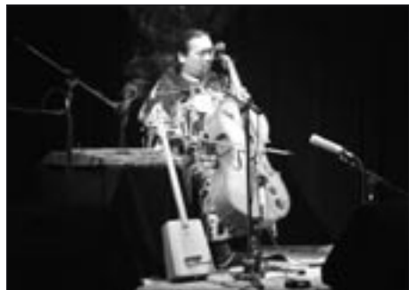
V poličském divadelním klubu vystoupí Gendos ve středu 15. března v 19 hodin.