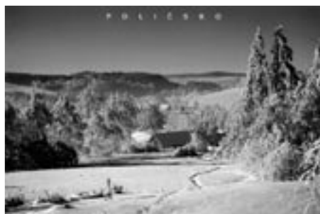
Zimní pozdrav z Vysočiny

kteří k výběru pohlednic sestavilo odbornou komisi. Ta pak z cca 80 pohlednic vybrala za celý turistický region 10 nejhezčích a ty byly zaslány do finále této soutěže.