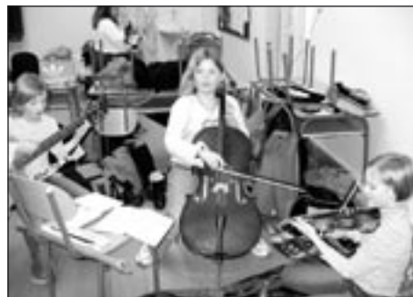
Praha-přípravy na celostátní kolo Dětské porty

Členové oddílu Vodáků se snaží maximálně využít času a vody na našich tocích. Za dobu své existence sjedlili na lodi téměř všechny české i mo-