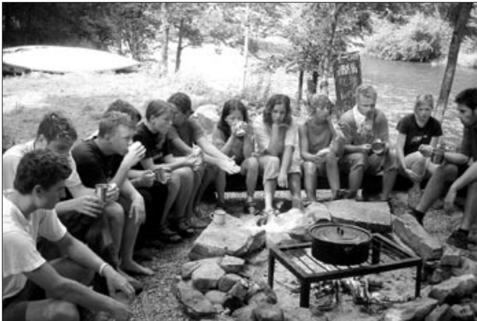
Čekání po dojezdu jedné z etap na Hronu.

Další oblastí našich zájmů je táborová základna u Pusté Rybné. Ta je krom letních táborů využívána i ve zbytku roku jak našimi členy, tak skupinami z jiných organizací. Obzvláště veselo bylo o Vánočních