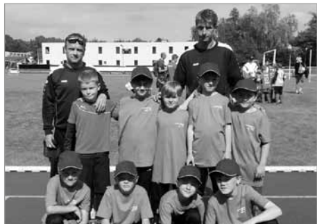
Finále PKFS mladších přípravek

Před domácím publikem odehrála v sobotu 20. 5. starší příprava poslední kolo Krajské soutěže přípravek sezony 2016 – 2017. A představení to bylo velice povedené. Předvedené hře našich svěřenců netleskalo pouze domácí publikum, ale často uznale i fanoušci soupeře. Navíc jsme k tomu