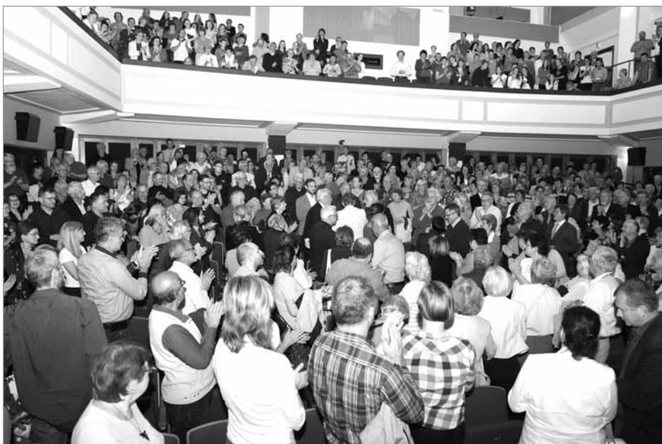
Po premiéře filmu