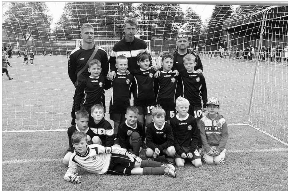
Benjamin cup Žďár nad Sázavou

vše v posledních minutách zápasu nezvládne nebelepší tým.