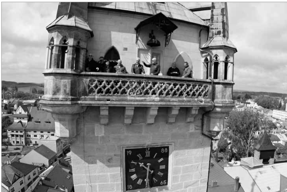
U světničky B. M

při oficiálních i neformálních schůzkách. Oba pánové po 50 letech opět vystoupali na natáčení v rodné světničce B., M.A. složili hold jeho géniu u hrobu na místním hřbitově. Na výletě s členy Spolku navštívili na Českomoravské vysočině některá místa spojená s Bohuslavem Martinů. Při loučení neustále zdůrazňovali svou vděčnost