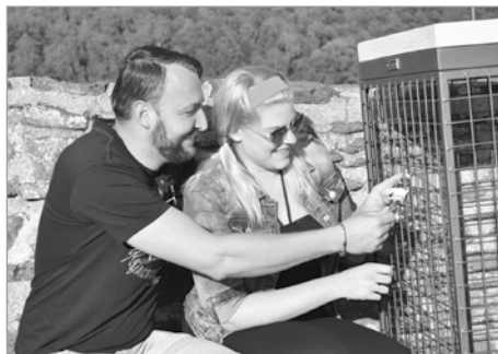
Na hrad se zámek