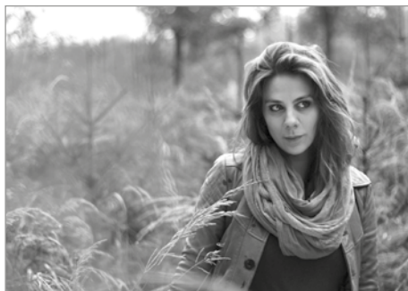
Aneta Langerová

„Následovat bude perlička letošní sezony – koncert Anety Langerové, a to 13. července od 20.30 hodin. Zpěvačka společně s kapelou a smyčcovým triem představí projekt Na Ra-