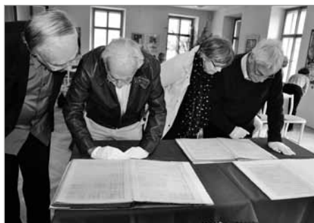
Originální rukopisy B. M.