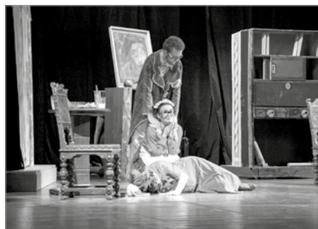
Českou Třebovou zastupoval soubor Hýbl.