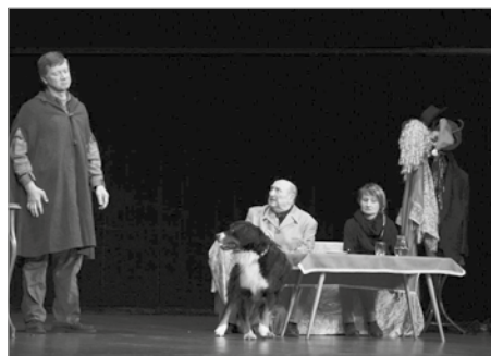
Na přehlídce nechyběli ani domácí ochotníci.

Jako první se publiku představil domácí Divadelní spolek Tyl, který nastudoval hru Alejandra Casona – Stromy umírají vstojе. Jednalo se o ly-