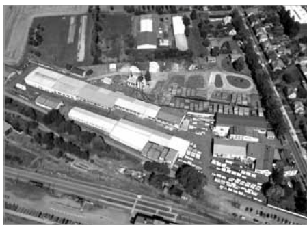
Letecký pohled z roku 2017

V únoru 1989 vypukl požár v prostoru lakovny, která i s přilehlým skladem hotových výrobků vyhořela; škoda byla mnohamilionová, neboť ve skladu bylo mimo jiné zničeno i několik tisíc vojenských beden. V této situaci podnik „vstoupil“ do revolučního roku 1989.