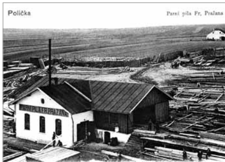
Pilnice v roce 1903