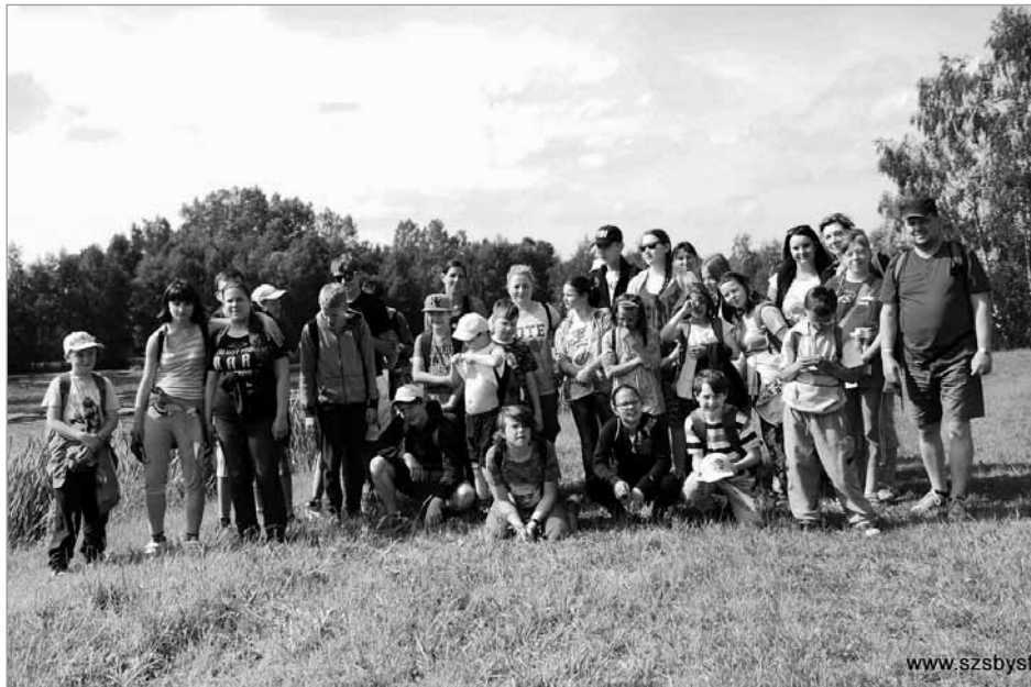
V Borové bylo krásně