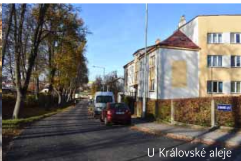
U Královské aleje