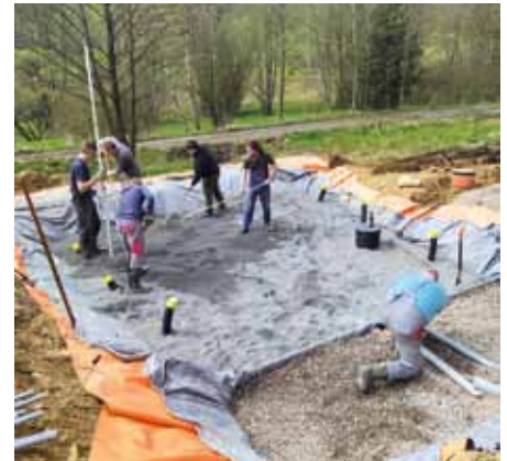
Kořenová čistírna na hájence

Pokračuje výroba a péče o ptačí budky, výroba a umístění 16 ks berliček pro dravce, pravidelné čtvrtěční schůzky a víkendové výpravy. Na letním čundru jsme pochodovali podél řeky Bobruvky. Bylo nás 16 dětí, 3 už ne děti, 2 dospělí a 1 důchodce. Během 6 dní a 5 nocí jsme spali 1x pod plachtami, 4x pod širákem, navštívili jsme 2 zříceniny, 1 rozhlednu, 1 koupaliště,