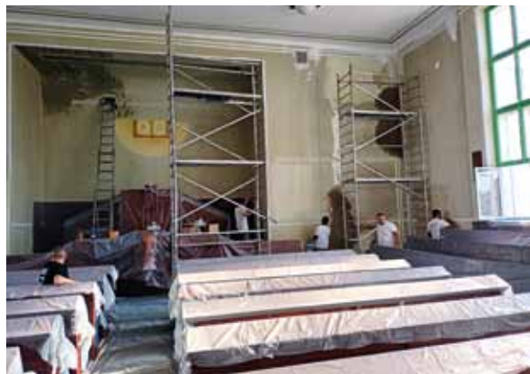
Výmalba chrámových prostor