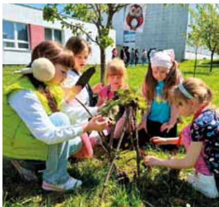
Výuka na zahradě

Žákům naší školy nabízíme kvalitní základy vzdělání a s kolegy u dětí rozvíjíme nadání,