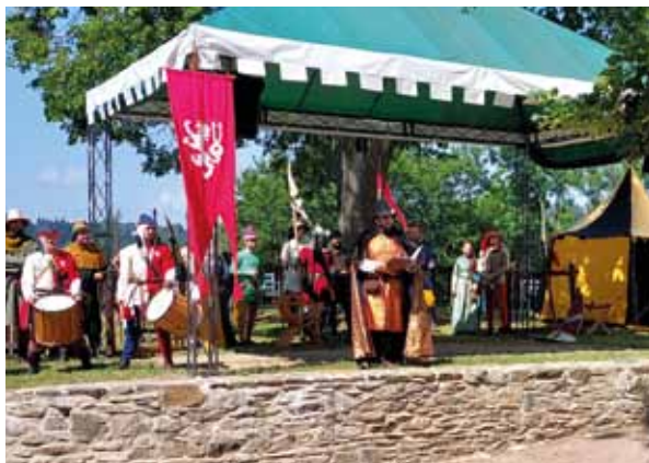
Oslava 800 let

Během sezóny se konala řada kulturních programů, mimo jiné Jarní slavnosti, Hradní jarmark, Pohádkový Svojanov, Královské slavnosti, Dny útrpného práva, Divadelní pouť, Třicetiletá válka a mnohé další. Mimořádnou akcí byla oslava 800 let od založení hradu. 80 účinkujících vystupovalo na třech stanovištích v areálu hradu.