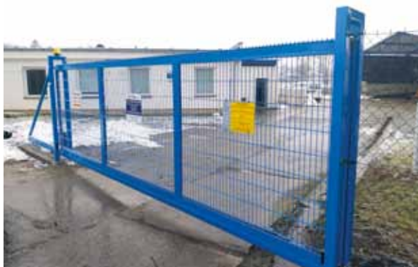
Nová odsuvná brána ČOV