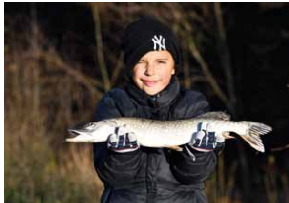
Poličský candát 2024