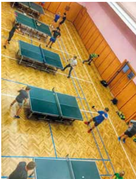
Trénink v Sokolovně