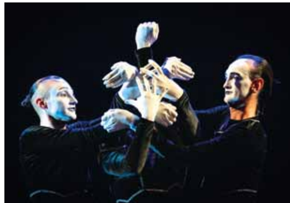
Dekru (UA), Virtual reality, MIME FEST 2024

V rámci vzpomínkové akce Velvet Listopad jsme si připomněli 35. výročí sametové revoluce. Součástí bylo scénické čtení s názvem Kdybych měl křídla v podání žáků Dramatického kroužku Tyl pod vedením režisérky Vero-