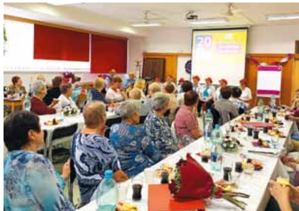
Oslava 20. výročí Poličské univerzity třetího věku

Pro obyvatele města Poličky a spádových obcí v DPS pracovalo 29 zaměstnanců na hlavní pracovní poměr a 10 dalších na DPP. DPS Polička svými bytovými, pečovatelskými a stravovacími službami pokrývá potřeby města Poličky a nejbližšího okolí, ale zejména volnočasovými