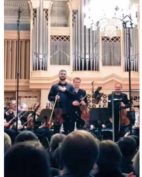
Dny Bohuslava Martinů