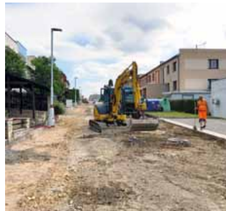
Stavební úpravy ul. Haškova