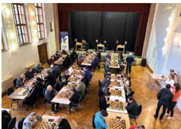
Turnajový sál Poličského rapidu 2024