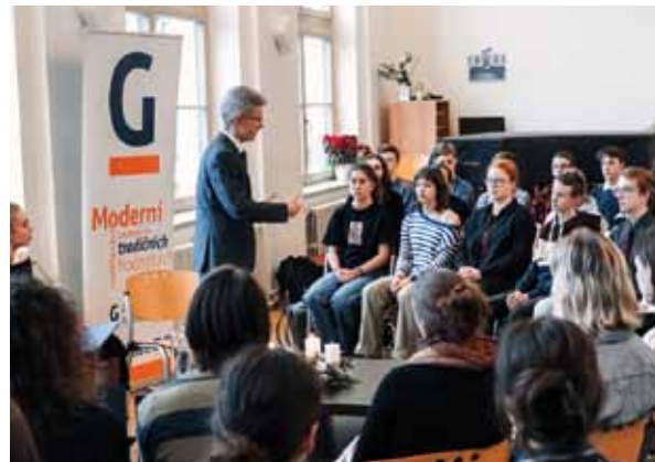
Návštěva předsedy Senátu ČR Miloše Vystrčila

Zájemcům o studium můžeme doporučit prohlídku školy v rámci dne otevřených dve-