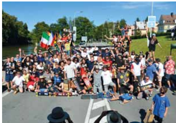
Skate n Roll Policka 2024

Děkujeme všem za velkou podporu, městu Polička v čele. Sezona 2024 byla famózní, ale