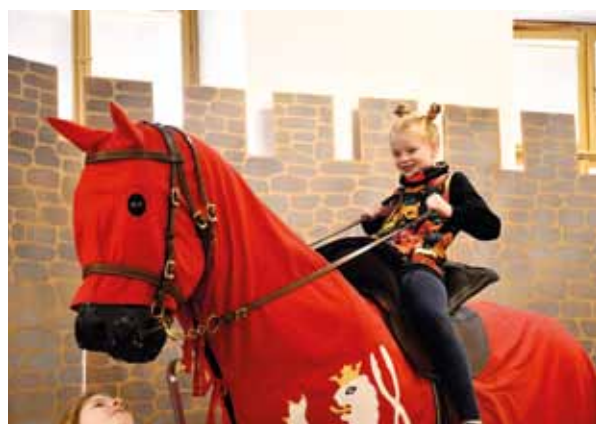
Vzhůru do středověku!

V roce 2024 to v muzeu opět žilo! Muzejníci připravili 7 výstav různorodého zaměření. Mohli jste se vydat Vzhůru do středověku, odtajnit Příběhy dřevěných hraček, prozkoumat