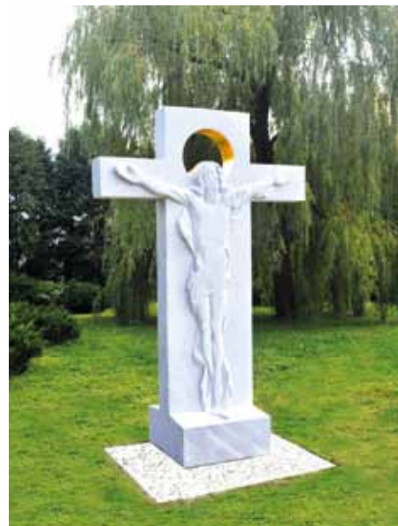
Nový kříž na Centrálním hřbitově v Poličce

17. srpna v Poličce proběhlo celorepublikové setkání Společnosti B. Martinů, tato společnost existuje již 45 let.