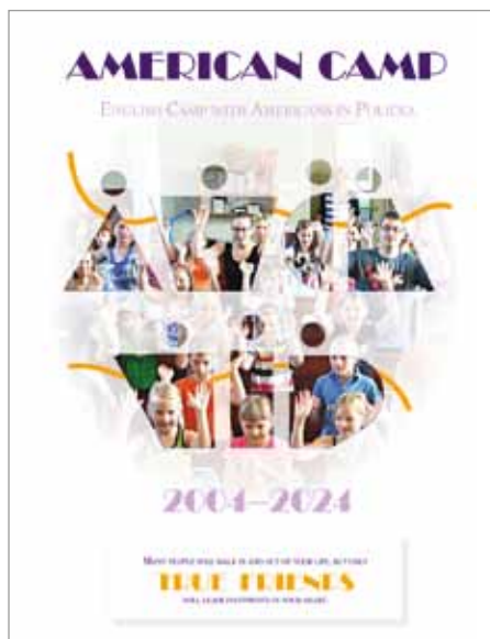
Almanach k 20 letům Tábora s Američany

K tomuto výročí sbor vydal tiskem almanach s množstvím fotografií a s řadou vzpomínek a vzkazů těch, kteří se do tábora zapojili (online na https://policka.evngnet.cz/vydane-publikace ).