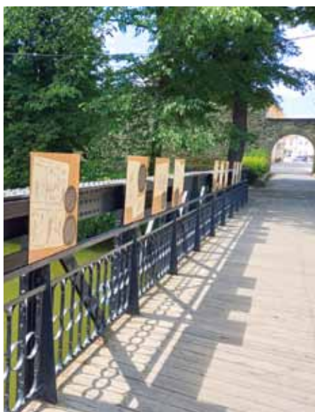
Výstava na mostě

Barokní radnice slaví 280 let, základní kámen byl položen 22. dubna 1744. Přesně po 280 letech zde zasedli i poličští radní, ke svému jednání.