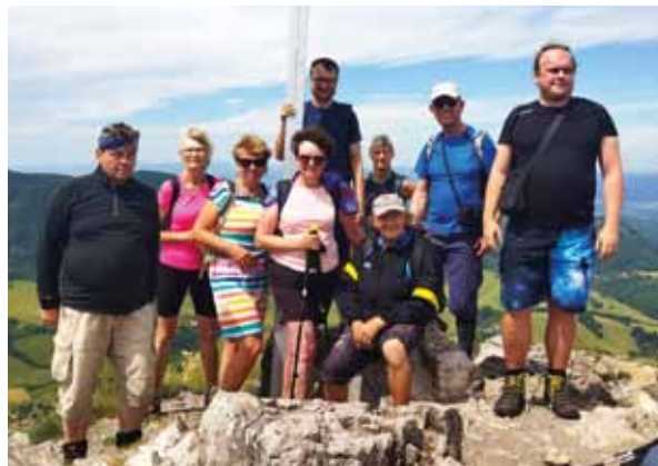
Z hory Vápeč

Značení a údržba turistických značek je nedílnou součástí aktivit KČT. V r. 2024 došlo k rozšíření pěších značených cest: byla žlutě vyznačena trasa z Květné od hostince přes