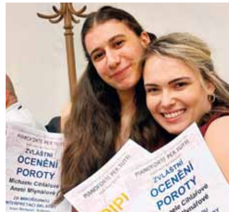
PFT per tutti Příbor II