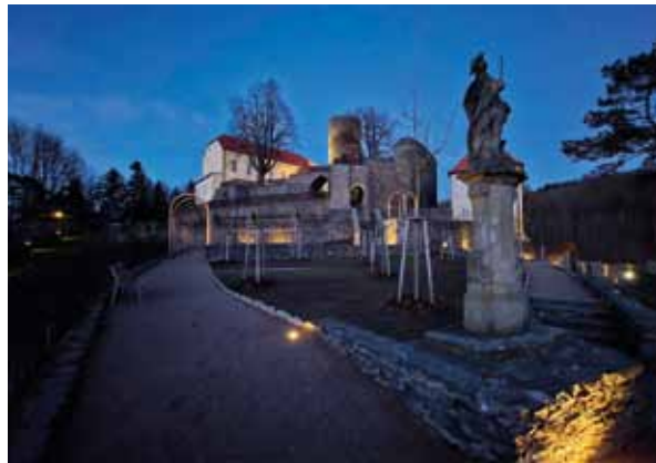
Gotická zahrada za nočního osvětlení

Po celý rok probíhala revitalizace gotické zahrady. V rámci ní došlo k obnově záhonů i výsadby, vzniku nového vinohradu, výstavbě nového vyhlídkového altánu a dřevěné pergoly