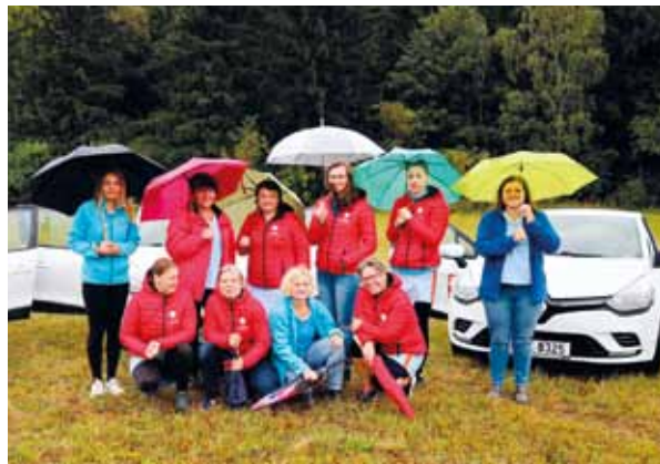
Zdravotní sestry z Domácí zdravotní péče

Po celý rok poskytovali zdravotní sestry, pečovatelky a asistentky, sociální pracovníci, pracovníci v přímé péči, psychologové, peři,