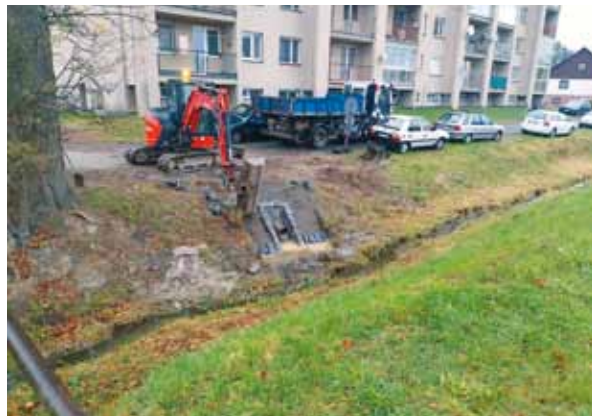
Výměna kanalizace na ul. Družstevní