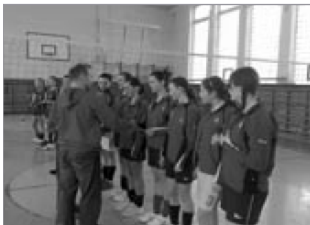
Kadetky přebírají zlaté medaile

O něco těžší pozici mají děvčata v trojkovém volejbalu. Také vedou svůj krajský přebor, ale do konce soutěže jim zbývají čtyři kola. Ohrozit