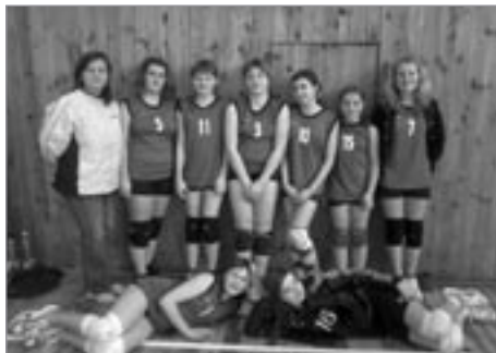
Družstvo mladších zákyň

To zelená děvčata měla den, bez porážky vyhrála