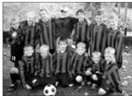
Mladší elévové Polička