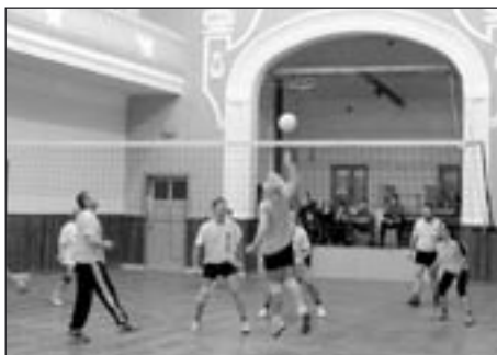
Družstvo ASPV (na vzdálenější straně) a Telecř