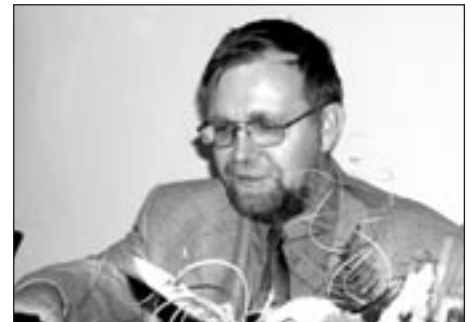
Poslanec Parlamentu ČR Radko Martínek

Dne 7. října přijel v rámci svého poslaneckého dne do Poličky poslanec parlamentu ČR Radko Martínek. Na setkání s vedením města i starosty obcí v regionu projednal osud žádostí o dotace ze státního rozpočtu v roce 2005. Bohužel v důsledku snahy o snížení schodku byly plošně všechny požadavky kráceny přibližně o 50%. Tím se dostává do problémů financování výstavby tělocvičny na Masarykově základní škole.