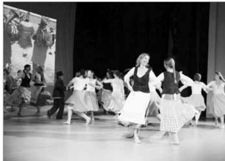
Z vystoupení ZUŠ Bystré

Druhý koncertní večer Graffova kvarteta začal odlehčeně smyčcovým kvartetem D dur Karla Stamice a Loveckým kvartetem B Dur W. A. Mozarta. Po přestávce zazněl smyčcový kvartet BM č. 7 „Concerto da kamera“. Bezprostředně jsme mohli vyslechnout rozdíl hudebního stylu a jeho vnímání druhé poloviny 18. století a hudební výraz století dvacátého. Po kolikáté nás svou všestranností BM překvapil; jeho smyčcový kvartet č. 7. Concerto da kamera je opět zaplněn překvapivými obraty a hudebními tématy, na nichž by leckterý skladatel postavil celou skladbu. Ne tak BM - lehce opustí krásný motiv, aby se k němu už nevrátil.