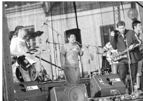
Trio de Janeiro

V letošním roce jsme začali uvažovat o dramaturgii 21. ročníku festivalu Polička *555 už v lednu a vybrané kapely jsme kontaktovali a následně sepsovali smlouvy.