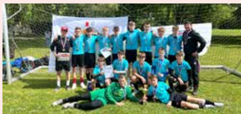
Putovní konference MAS Poličko aneb „Ztraceni v digitalizované Masaryčce“

Ve čtvrtek 9. 5. se osmáci zúčastnili exkurze na Praděd, prošli turistickou stezkou přes chatu Barborku, Bílou Opavou do Karlovy Studánky, a to za velmi pěkného počasí.