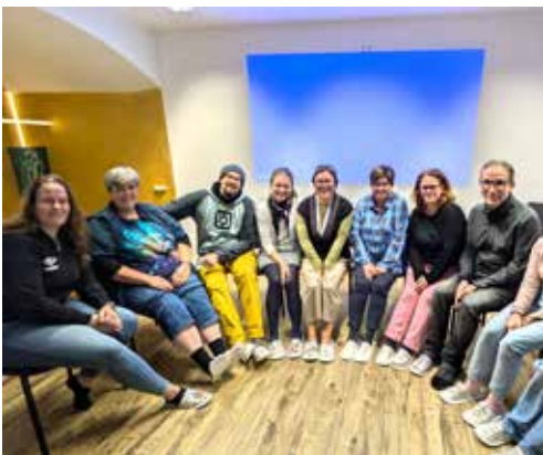
Tým domácího hospice v papučích v rámci kampaně Dožít doma

Oblastní charita Polička policka.charita.cz