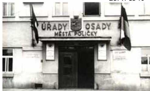
Úřady Osady města Poličky před zrušením (12. 6. 1941)