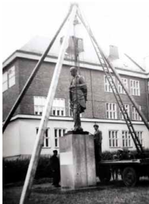
Snímání sochy T. G. Masaryka, 25. 7. 1940