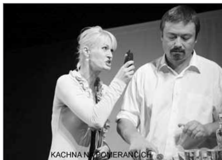
KACHNA NA POMERANČÍCH

sunuté peripetie notoricky známého příběhu mlynáře, Haničky, Kláška, Kláskové, Mandáta, vrchního a vodníka Michala. Zcela v současném duchu inscenací médií, veřejnoprávní TV nevyjímaje, je nutno diváka vhodně nabudit pravidelnými dávkami lechtivých gest či dvojsmyslů, aby bylo dosaženo cejchu aktuálnosti. Chci však říct, že vše proběhlo