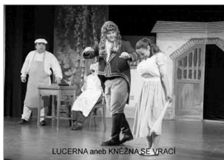
LUCERNA aneb KNĚŽNA SE VRACÍ