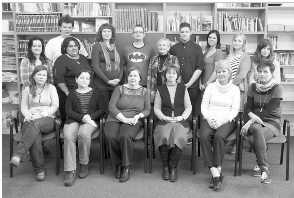
Kolektiv pracovníků a dobrovolníků knihovny