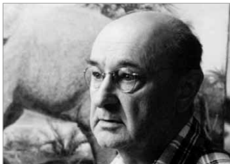
Zdeněk Burian, geniální malíř a ilustrátor

V neděli druhého března začneme vernisáží výstav Zdeňka Buriana , geniálního malíře a ilustrátora. Snad každý jeho dílo zná: dinosauři, mamuti, pravěcí lidé...rodiče zavzpominají, děti užasnou! Zdeněk Burian ilustroval na pět set knih,