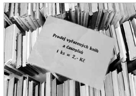
Od rána do večera s knihou

Od rána do večera se budeme knihám věnovat obzvláště ve čtvrtek 27. března . Připravena bude od devíti ráno burza vyřazených knih , v případě příznivého počasí náš stánek najdete na trhu. Bude-li pršet, nezmoknem, schováme se do knihovny! Odpoledne nahlédneme do knihařského řemesla a budeme pod odborným vedením