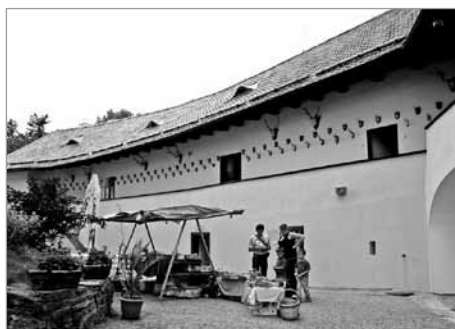
Sbírka loveckých trofejí zdobí vstupní nádvouří hradu

níkům připomněla ponorou atmosféru krutého období 1. poloviny 17. století, které se i na Svojanově negativně vrylo do dějin hradu a jeho okolí.