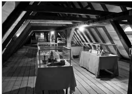
Výstava modelů v podkroví domu zbrojnošů