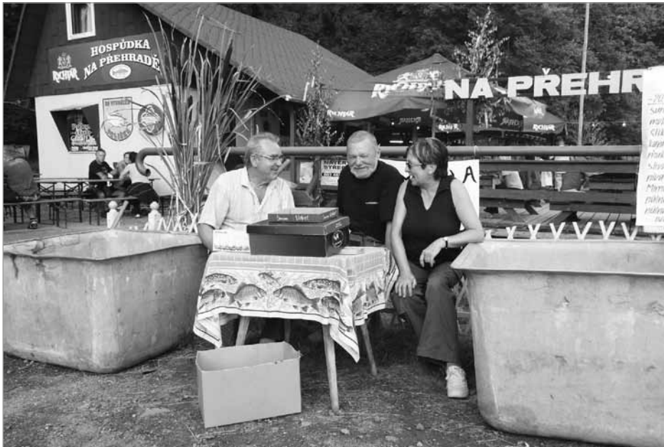
Vše je připraveno, areál vyzdoben, rybolov i taneční rej mohou začít.

V pátek 8. srpna se na přehradě Pod Kopcem uskutečnila výjimečná, zcela ojedinělá akce, nesoucí název Půlnoční sumec – Rybářská noc. Originalita tohoto závodu (letos proběhl už III. ročník) přilákala na start několik desítek rybářů z blízkého i vzdálenějšího okolí, ale především veřejnost, která se rozhodla si v hezkém prostředí zatančit a odpočinout.