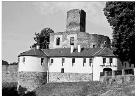
Vstupní průčelí zdobí slavnostní prapory