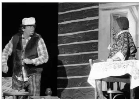
Pohádka o ševcovi