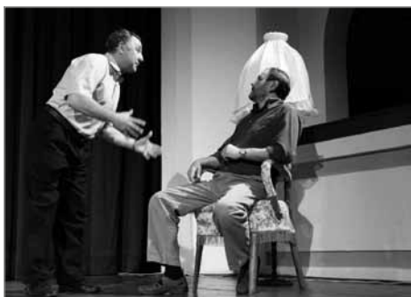
Vrátila se jednou v noci