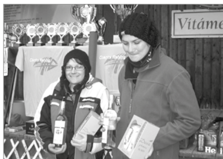
Odměna dvěma ženám ve startovním poli

úspěšný rybář, ale také jako prodejce rybářských potřeb. Zcela mimořádný byl tento závod v tom, že bylo přichystáno deset pohárů pro nejlepší namísto obvyklých tří.