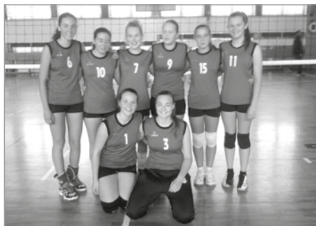
Starší žákyně na ČP

příliš nevydařil, a tak domácí Slavie brala cenné body. Pak se ale rozjel poličský tým k nebývalým výkonům. Porazil Zlín, Vamberk, Pardubice, Frenštát pod Radhoštěm a Frýdek – Místek. Výhra v posledním zápase nad Českou Třebovou by znamenala vyhrát celý turnaj. Byl to boj, vyhráváme 1. set 26:24 a stejně bojovně vstupujeme do setu druhého, prohra v koncovce 22:25. Tiebreak Polička již nezvládla. Děvčatům se podlomila kolena. Konečně třetí místo a zisk 17 bodů bylo přesto famózní, stejně tak jako předvedený výkon. Hra bez chyb a volejbalové srdce slavilo úspěch. Zlepšená