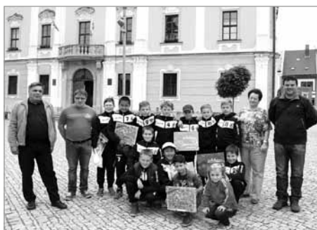
Úspěšní mladí fotbalisté se zástupci města

K soupeřům patřila v základní skupině mužstva z Hlinska, Pardubic, Holic a z Moravské Třebové. Nutno zdůraznit, že ve finále celého turnaje se utkali borci z Hlinska a z Pardubic, což potvrzuje velmi silné složení naší základní skupiny.