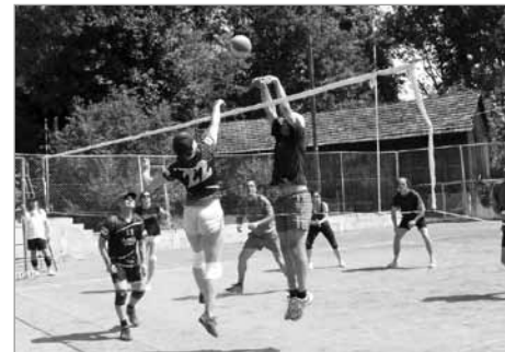
Momentka ze zápasu Antik vs. Kameneč

V parný sobotní den 18. 7. se konal na antukových hřištích areálu Pod Lípou v Kamenci u Poličky 16. ročník turnaje Kamenecké podání, kterého se zúčastnilo pět družstev. Dva týmy se rekrutovaly u nás a zbylé byly přespolní ze Svitav, Bechyně a Lelekovic.