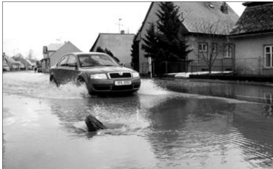
Zatopená Hegerova ulice v pátek odpoledne