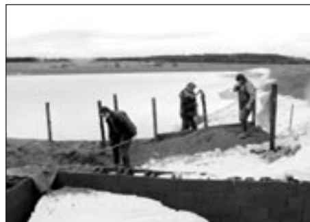
Při regulaci odtoku z poldru výrazně pomohli rybáři

„Rád bych touto cestou poděkoval panu mís-