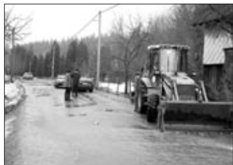
Voda brozila i ve Strážezí