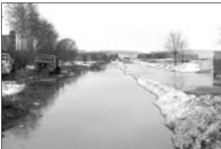
Zaplavené území za nádražím (foto S. Sáňka)

„Nejhorší situace byla od pátku od osmi hodin do soboty, kdy se jednalo o to, zda v Poličce udržíme na suchu ulici Družstevní a Penzion, včetně přilehlých domků. Ráno voda trochu „pozlobila“ v obci Střítež, což v podstatě z pozdějšího pohledu byla malá záležitost. O půl jedenácté vtrhla voda z polí směrem naproti marketu Plus Discount, kde jsou pole Agroney. Zde došlo k nabrodění velkého množství vody, která zde vytvořila jezero a voda nenašla cestu do svého původního koryta a nečekaně se valila na ulici Hegerova, kde byly zatopeny asi dva sklepy. Tuto situaci jsme napravili během dvou hodin s pomocí bagrů firmy Pásek a firmy VHOS, kdy se vytvořilo za domy náhradní koryto.