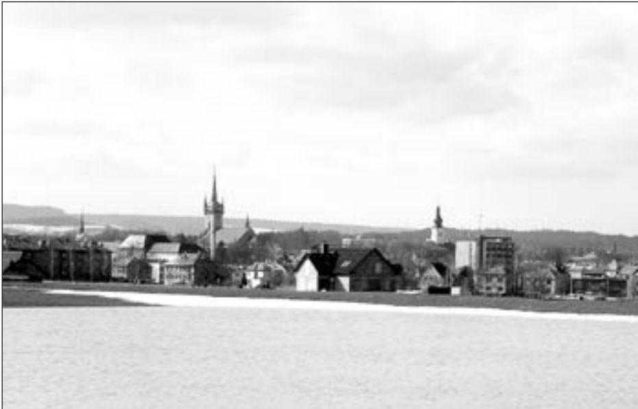
Naplněný poldr pomohl - v pozadí první domky v lokalitě Mánesova