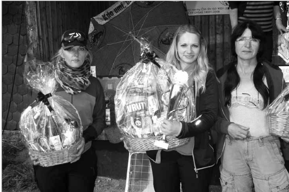
Václavská trofej: vítězky kategorie žen

„I letošní pátý ročník Václavské trofeje probíhá v den svátku sv. Václava na jeho počest. Tentokrát jsme ale v propozicích závodu udělali oproti dřívějšímu změnu v tom smyslu, že se jen muškaři a vláci (odpadlo chytání kaprů). Máme velikou radost, že nám vyšlo počasí a také z počtu účastníků – přijelo 158 rybářů z celé republiky a ze Slovenska, což je rekord. Revíry jsme, jako obvykle, bohatě zarybnili, přibýlo v nich zhruba 5 500 ryb (4 000