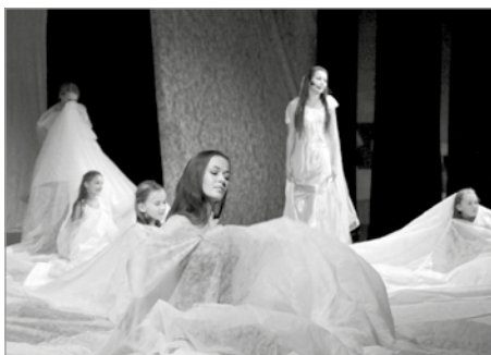
Orfeus a Euridika

A najednou se setkáme s inscenací bysterské ZUŠ, která nám předloží dvě paralely, z nichž každá s různými lidskými peripetiemi nakonec vyústí v jediné poznání: Osudu neunikneš. Postaví se mu jak Orfeus tak mladík s kytarou, chránící svou tajnou lásku před drogami; svůj osud musí naplnit. Tak je psáno.