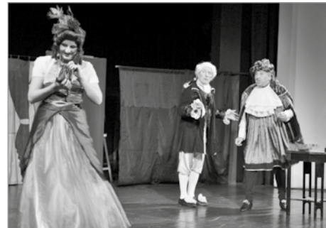
S čerty nejsou žerty