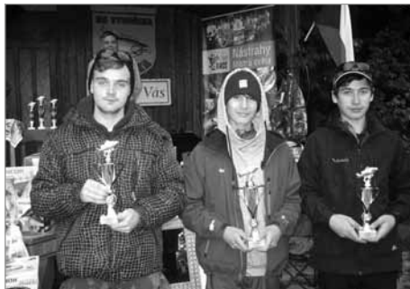
Mládež do 18 let

V sobotu 17. října 2015 se v areálu Rybářského sdružení Vysočina Polička „Pod Kopcem“ konal už 20. ročník závodu v lovu pstruhů a štik na mušku a přívlač. Sešel se na něm rekordní počet 240 rybářů ze všech koutů republiky, opět přijela i početná skupina kamarádů ze Slovenska. Z toho důvodu závod probíhal na dvou nádržích (číslo 1 a 2). Hospodář Jaroslav Martinů k tomu řekl: