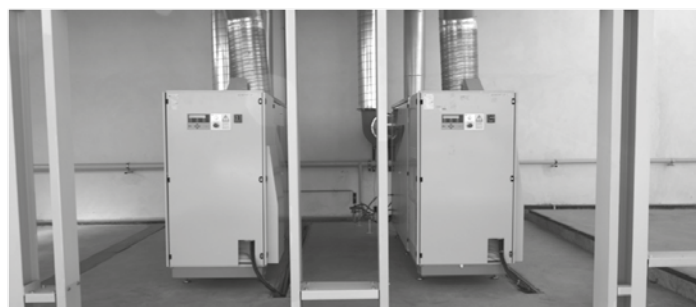
Trigenerace v podmínkách Flídr Využití mikroturbíny pro kombinovanou výrobu tepla a elektrické energie.

V letošním roce jsme uzavřeli smlouvu s italskou firmou Ansaldo Energia s.p.a. o výhradním prodeji mikroturbín na zemní plyn, turbín na bioplyn (vhodných pro bioplynové stanice zpracovávající zemědělský, komunální a průmyslové odpad) a turbín na syntetické plyny, pro území České a Slovenské republiky.