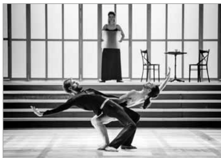
„Záběr z brněnské inscenace Epos o Gilgamešovi“

Jarní měsíce letošního roku jakoby hudbu Bohuslava Martinů přitahovaly. Tak bychom mohli vysvětlit hezkou řádku koncertů a inscenací, které se v posledních týdnech „urodilý“. Řeč bude především o Brnu, moravské metropoli, která byla poličskému rodákovi Bohuslavu Martinů vždy příznivě nakloněna. Koneckonců, o tomto bude podrobně pojednávat podzimní výstava Bohuslav Martinů a Brno, která se bude konat 17. 9. – 6. 11. ve výstavních prostorách poličského muzea.