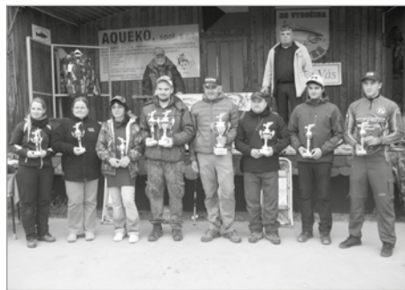
Na snímku jsou všichni držitelé pohárů ve všech třech kategoriích. Pokud vám neuvchází počet, tak si všimněte, že jeden člověk má poháry dva.

Letos jich přijelo 271 nejen ze všech koutů republiky, ale i z okolních států – Slovenska, Maďarska, Rumunska, Polska... To byl také důvod, proč se závod musel konat na dvou nádržích (jsou známy jako „nulka“ a „jednička“), aby bylo všem zájemce kam umístit.