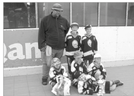
Na fotografii vítězná mužstva SK Kometa Polička s trenérem