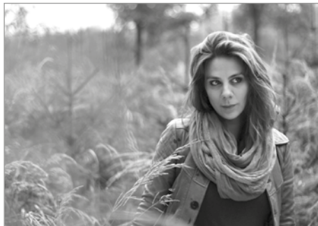
Aneta Langerová

„Následovat bude perlička letošní sezony – koncert Anety Langerové, a to 13. července od 20.30 hodin. Zpěvačka společně s kapelou a smyčcovým triem představí projekt Na Ra-