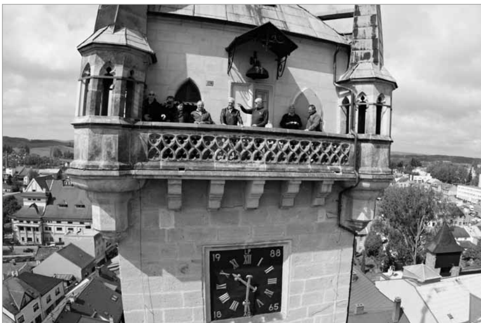
U světničky B. M

při oficiálních i neformálních schůzkách. Oba pánové po 50 letech opět vystoupali na natáčení v rodné světničce B., M.A. složili hold jeho géniu u hrobu na místním hřbitově. Na výletě s členy Spolku navštívili na Českomoravské vysočině některá místa spojená s Bohuslavem Martinů. Při loučení neustále zdůrazňovali svou vděčnost