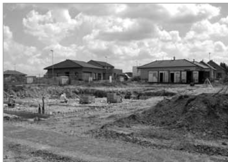
Bytové domy v lokalitě Bezručova

Městský park – stavbu realizuje vítězná firma PP-GROUP.cz s.r.o., celkové náklady jsou ve výši 6,9 mil. Kč. Stavební práce zahrnují novou dřevěnou lávku z modřínu, mobiliář a osvětlení na páteřní cestě parkem od velkého železného mostu směrem k Tylovu domu. Na dřevěnou láv-