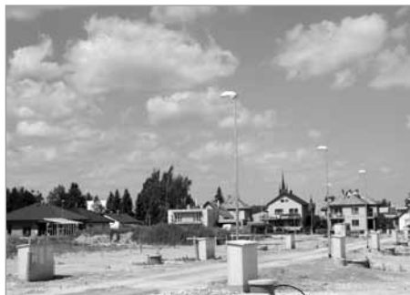
Inženýrské sítě – 2. etapa lokalita Bezručova

Inženýrské sítě – 2. etapa lokalita Bezručova – vybudování sítí v hodnotě 7 mil. Kč bylo