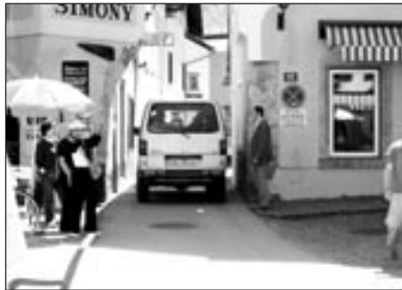
Turisty bojně navštěvovaný Hallstatt - výjezd z náměstí

V následujících řádcích se chci podělit se čtenáři Jiřienky o své postřehy, hlavně pokud se týká dopravy. V žádném navštíveném městě není vyloučena doprava ani parkování v centru. Pěší zónu (jedna ulice) jsme viděli pouze v lázeňském městečku Bad Ischl.