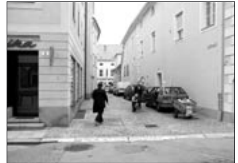
Takto se běžně parkuje

Raději se nepeptejte poskytovatelů různých služeb, zásobovačů a obchodních zástupců, kteří byli za „nesprávné“ parkování při výkonu svého povolání