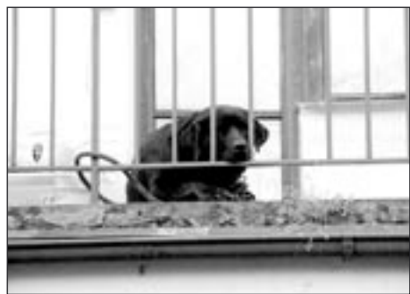
Pes bezdomovec - jeho bouda se také stala exponátem Času pro neobyčejné zážitky

Hudební žánr byl zastoupen vystoupením harmonikáře v městské knihovně a poněkud improvizovanou – když nedorazili nasmulovaní profesionálové – kytarovou produkci u ohně ve dvoře sousedního domu.