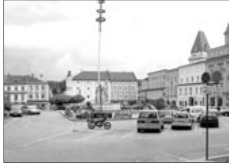
Náměstí ve Freistadtu

Město je tak bohaté a hezké, kolik má bohatých občanů. Množství pěkných a dobře zásobených ob-