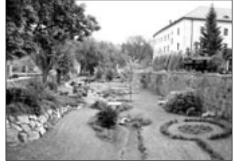
Část parkánového příkopu