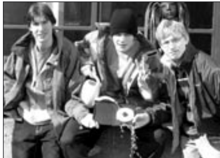
Film si tvůrci pokřtili sami

Ve filmu Marie pronese: „Jdu tomu světu ukázat.“ Tvůrci filmu světu ukázali.