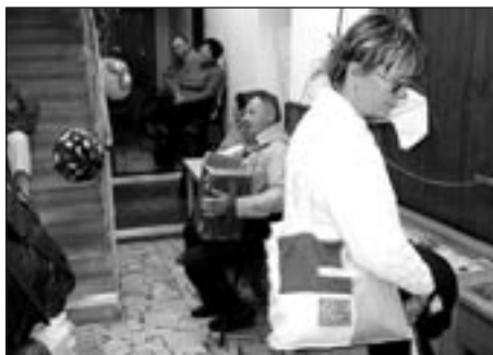
Neobyčejný zážitek - harmonikář v knihovně

Doufáme, že neobyčejné zážitky z „Masaryčky“ přispějí ke sblížení školy s poličskou veřejností, neboť jasně ukázaly, že děti nejsou jen agresivní a nevychované bytosti, ale že mají citlivou duši, která, když dostane patřičnou péči a vedení, umí potěšit, pohladit a dodat krásu do všedních dnů. JF