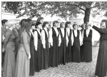
Zpívání pod širým nebem v Litomyšli s několika členkami pěveckého sboru Vlastimil.