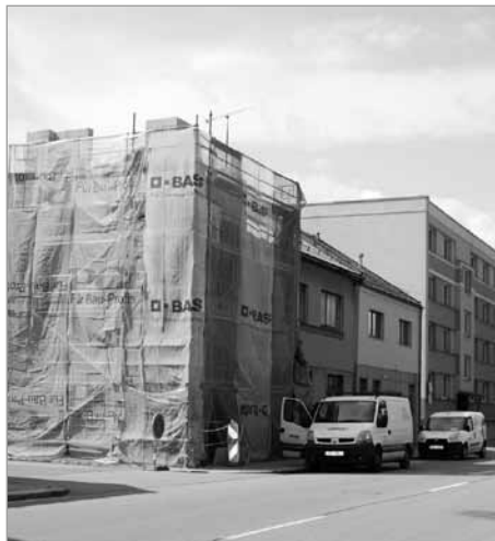
Rekonstrukce domu na ulici 9. května – náklady 11 mil. Kč, z toho 7 mil. hrazeno dotací, dokončení – říjen/listopad 2018, v domě vznikne 6 sociálních bytů