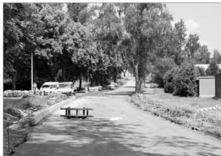
Ulice Zákrejsova – rekonstrukce silnice – 18 mil. korun (Pardubický kraj), oprava chodníků po obou stranách ulice – více než 3 mil. Kč, 85 % nákladů hrazeno z dotace (město Polička)