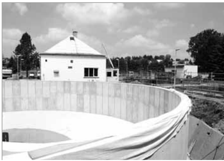
Intenzifikace ČOV Polička – náklady více než 40 mil. Kč, dokončení září 2019