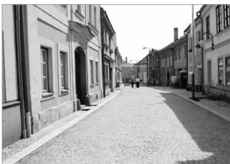
Rekonstrukce ulice Šaffova – náklady 13 mil. Kč (včetně ulice Tylovy), dokončení srpen 2018