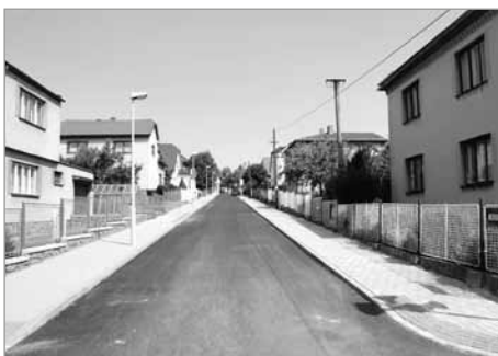
Nerudova – nové chodníky a asfaltový povrch silnice