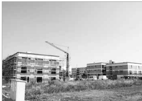
Lokalita Bezručova – dokončení výstavby nových bytových domů (48 bytů) – 57,6 mil. Kč, Předpoklad dokončení konec roku 2018