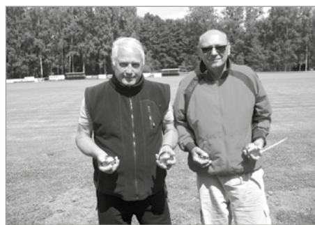
Rozhodčí a závodník po dokončení závodu.