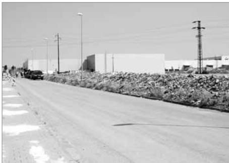
Výbudování nového chodníku v Průmyslové zóně Polička