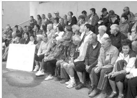
Závodníci těsně před startem