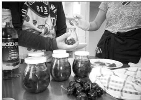
Výroba třešňové marmelády v Tvořivé dílně, foto Štěpánka Dvořáková

Jedná se především o osobní asistenci, jejíž kapacita je momentálně naplněna. To se v minulosti již několikrát stalo, naposledy před cca rokem, kdy došlo ke kolizi mezi počtem zájemců o službu a přidělenými dotacemi na zajištění personálu na sociální služby. Jednoduše – bylo málo prostředků, které by při nárůstu poptávky umožnily zareagovat a rozšířit tým asistentek. Letos se si-