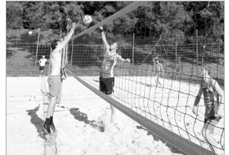
Souboj na síti v podání týmů RiJa a Špekové

Je sobota 11. 8., 5.38 hod. – budí mne zvuk kapek dopadající na střešní krytinu, který postupně sílí. Sahám po telefonu a zjišťuji, co na to praví Velký bratr. Mléčí. Alespoň o dešti v tuto hodinu. Oddechnu si, že skalní škarohlídové snad nebudou mít pravdu. Tvrdivají, že na termín a počasí na plážový volejbal máme čich. Vstávám