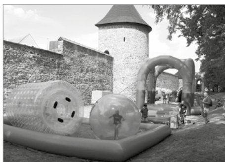
Děti v parku