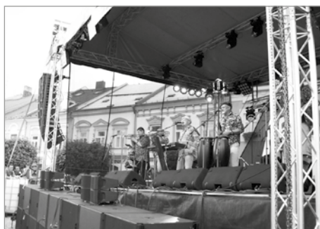
Yo Yo Band