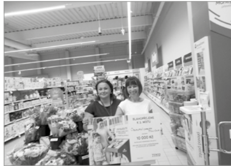
Převzetí šeku v Tesco Olomouc

Z daru Tesco budou zakoupeny herní prvky – houpačka a skluzavka. Pískoviště a lavičky zajistíme svépomocí – pomůže nám dřevodílna AC dílen.