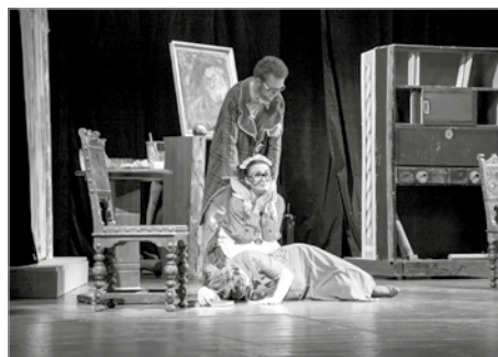
Českou Třebovou zastupoval soubor Hýbl.