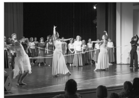
Představila se také Základní umělecká škola Bystré.

Festival Zákrejsova Polička pokračoval v sobotu 20. října opět komedií Poprask na laguně autora Carla Goldoniho. Jevišť Tylova domu patřilo Jednotě divadelních ochotníků Jaroslav z Luže. Přítomní diváci viděli jedinečnou komedii lidských charakterů. Zatímco nad lagunou