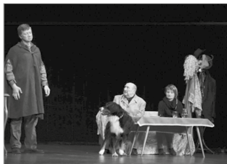
Na přehlídce nechyběli ani domácí ochotníci.

Jako první se publiku představil domácí Divadelní spolek Tyl, který nastudoval hru Alejandra Casona – Stromy umírají vstojе. Jednalo se o ly-