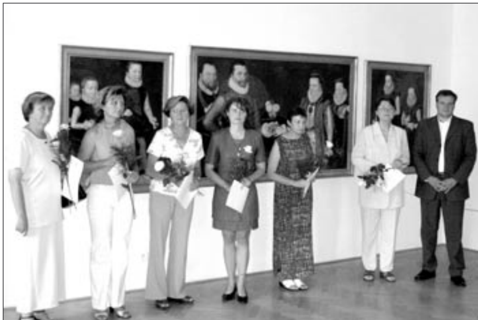
Ocenění pedagogičtí pracovníci