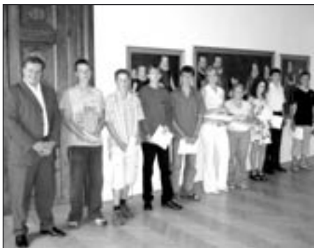
Starosta s nejúspěšnějšími žáky