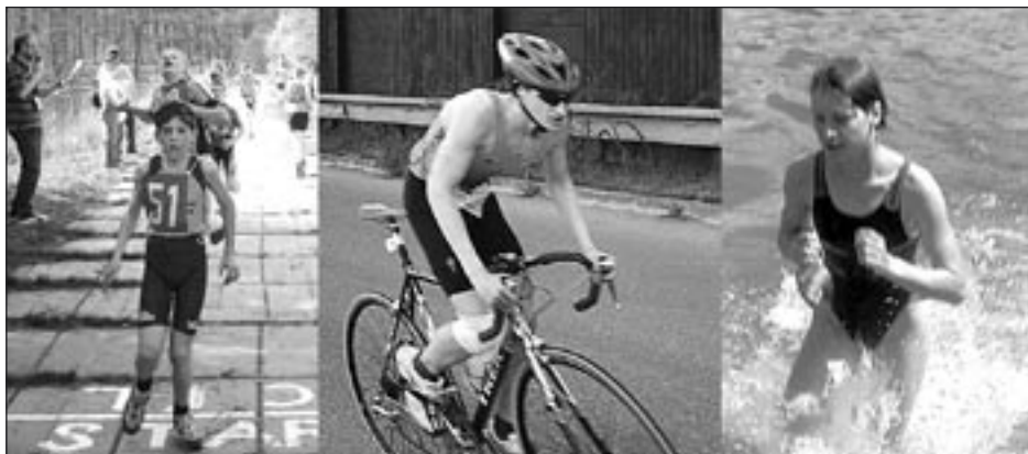
Naši závodníci v akci