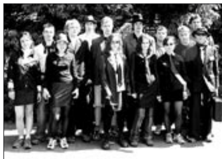
Famiglie Corleone: organizátoři soutěže

Mafie (někdy nazývaná La Cosa Nostra neboli „naše věc“) byla původně bezjemenná organizace osob na Sicílii, která vznikla za účelem ochrany a vymáhání práva, později se stávala čím dál více zaneprázdněná organizovaným zločinem. Členem mafie je tzv. „mafioso“ neboli „muž cti“.