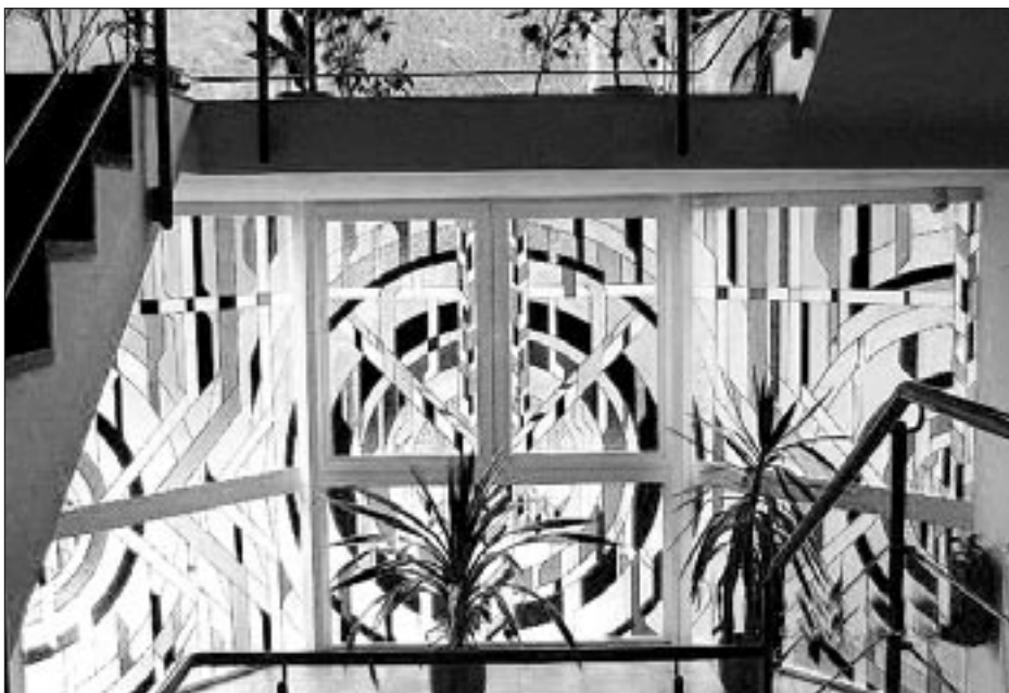
Zakázka pro Techplast Česká Třebová, sedmidílná vitráž - motiv galaxie