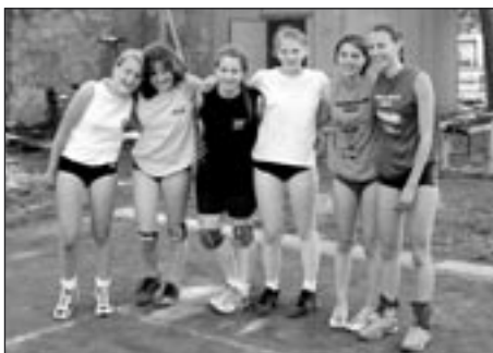
Spartánci - vítězky mládežnického turnaje