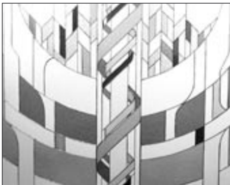
Detail zakázky pro Techplast

Děkujeme za rozhovor a přejeme vám do další práce mnoho úspěchů a spokojených zákazníků a v neposlední řadě dobré zdraví.