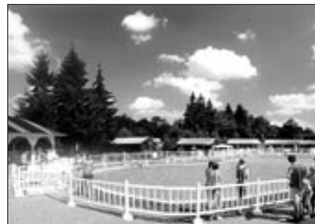
Kemp v Borové

„Titul Vesnice roku je především oceněním dlouhodobé práce starostek a starostů, které si nesmírně vážím,“ řekl člen Rady Pardubického kraje zodpovědný za životní prostředí, zemědělství a rozvoj venkova Petr Šilar s tím, že slavnostní vyhlášení výsledků se tradičně uskuteční na podzim ve vítězné obci.