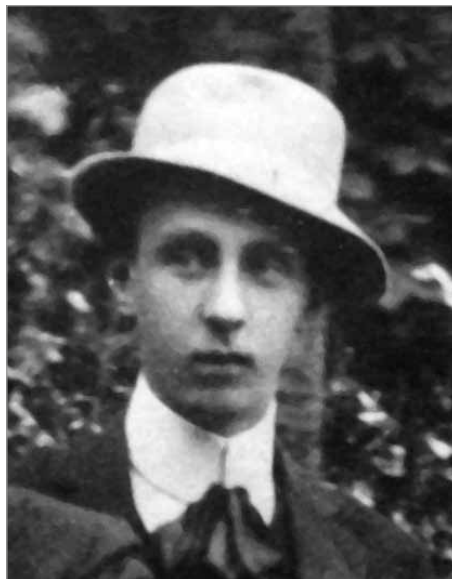
Martinů v době pražských studií

vení a koncertů: „Hlavním (zájmem) bylo Národní divadlo, kde jsme byli takřka denní hosté a kde jsme si vysloužili dvě místa „k stání“ na druhé galerii, jež byla všeobecně respektována... Naše radost byla ovšem komplikována tím, že bylo nutno