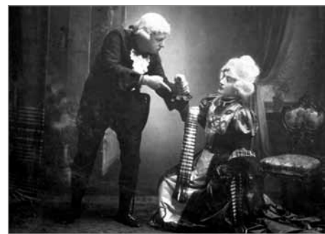
Divadelní hra Anežka (rok 1909)

„Na výstavě s názvem V HLAVNÍ ROLI DIVADLO ... aneb 200 let poličských ochotníků bude k vidění