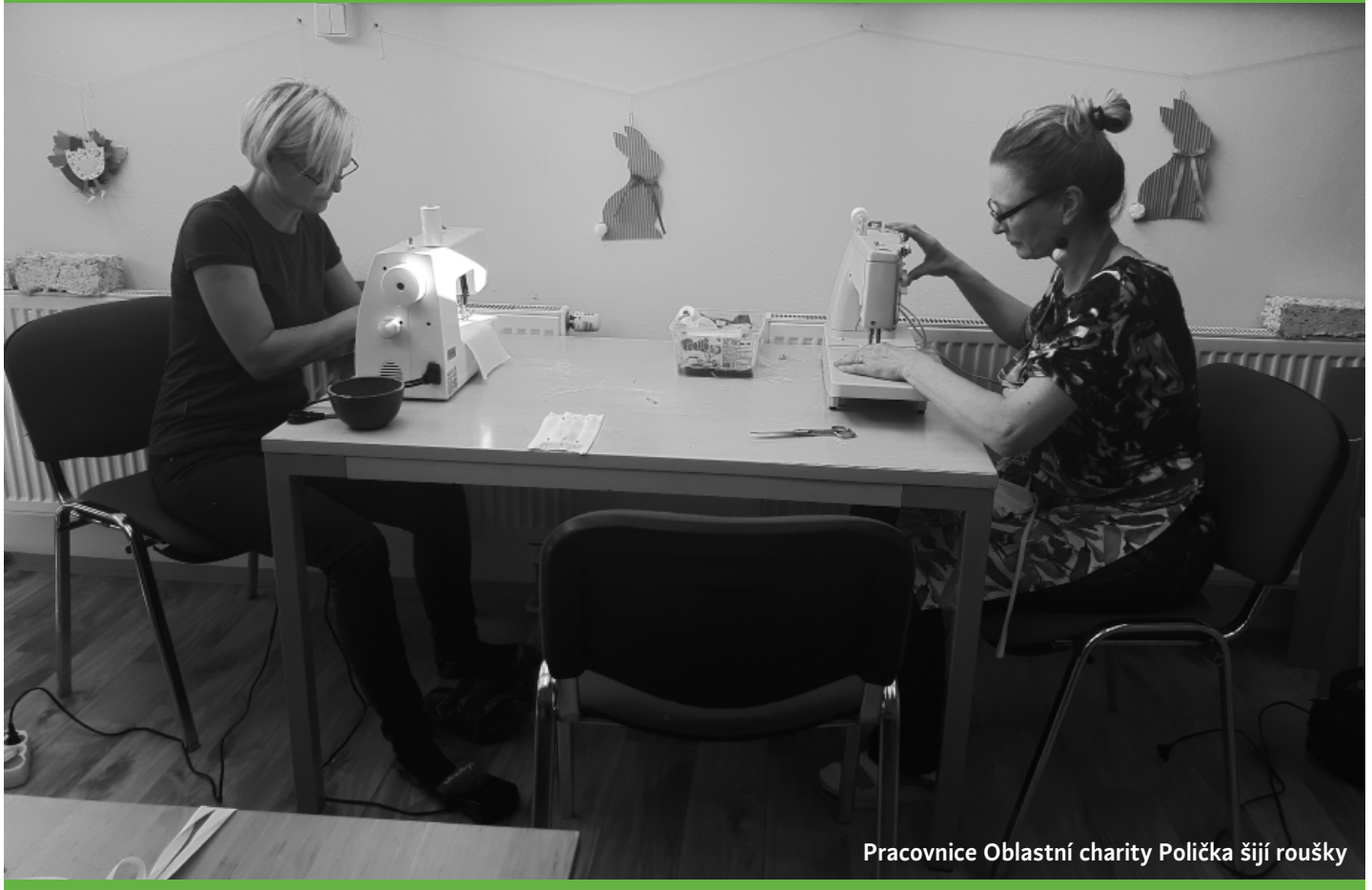
Pracovnice Oblastní charity Polička šijí roušky