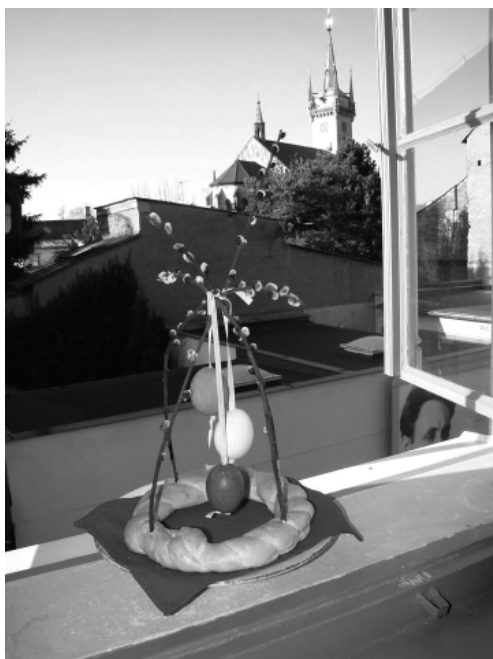
Přejeme všem Veselé Velikonoce