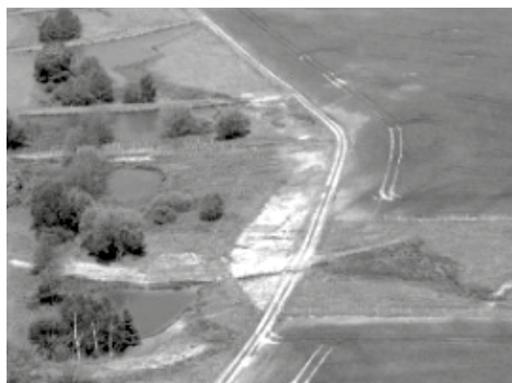
Zachytávání vody v krajině zasakovacími tůňmi – voda, které je v krátkém období nadbytek, všechna rychle neodteče, ale má šanci částečně zůstat v krajině