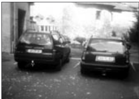
Pro holandské turisty není problém zaparkovat na záchytném parkovišti, zaplatit parkovné a dojít do centra pěšky

Pan Brabec v článku použil formulaci „námi placená městská policie“ a zřejmě tím chtěl dát najevo, že strážníci jsou povinni konat tak, jak se jemu líbí. Musíme připomenout, že je také placena těmi, co