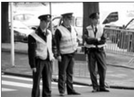
Belgičtí městští strážníci. Na region Lochristi čítající 20 tis. obyvatel dohlíží 70 (!) strážníků. Je nasnadě si obě čísla vydělit dvěma pro srovnání s poličskými poměry.

Souhlasíme s názorem, že je potřeba do Poličky