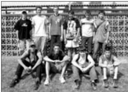
Družstvo starších žáků

Ve dnech 10. a 11.září se konalo v Jablonci na zcela novém nejkrásnějším atletickém stadionu, který připomíná orlí hnízdo na skále s výhledem