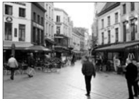
I takto lze řešit centrum města (nejsme zastánci pěší zóny) a zřejmě nikdo nebude belgické občany podezřívávat z totalitního myšlení, jak učinil ve svém článku pan Brabec.

Závěrem bychom chtěli připomenout, že údaje o činnosti MP, které se objevily v tisku, byly převzaty z celorepublikové statistiky, která neměla za cíl vyhodnotit, která MP je nejlepší, ale měla ukázat využitelnost jednotlivých městských policií v oblasti veřejného pořádku i v dopravě. Naše město nikterak nevybočuje v počtu řešených přestupků. Je nám jas-