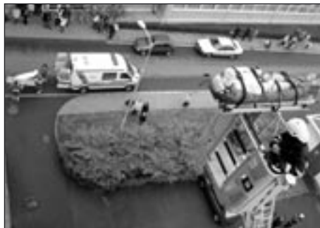
Zraněný je snášen na lehátko pomocí vysokozdvíhací plošiny

Po necelé hodině byli všichni zranění ošetřeni a požár uhašen.