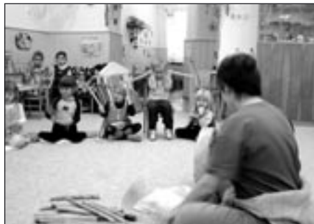
Ukázka z programu Zvuky přírody