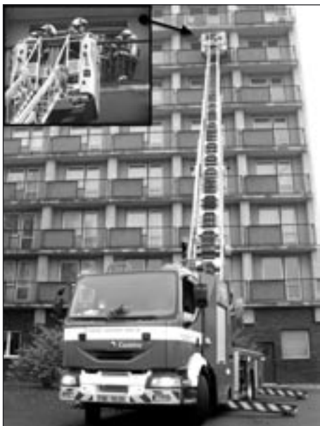
Zraněné v nepřístupném pokoji vyprošťovala speciální vysokozdvíhací plošina