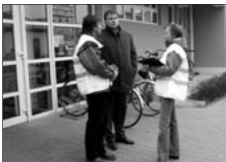
Cvičení řídil krizový štáb města

ze Svitav, která je schopná zasahovat až ve výšce 30 m. Uznání patří jejímu řidiči, který dokázal s velikým vozidlem přijet až k hotelu za 20 minut. Při pohledu na přemísťování figurantů na lehátko běhal mráz po zádech, protože se plošina silně kývala. Zkušební hasiči však spolehlivě dopravili obě uvězněné oběti na parkoviště za hotelem, kde se jich ujali zdravotníci.