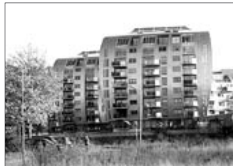
Architektura nového století u vodního kanálu

V řešení maximálního efektu za minimální prostředky jsou v s'Hertogenbosch velmi dobří. Na jeden z dotazů, jaký princip uplatňují při