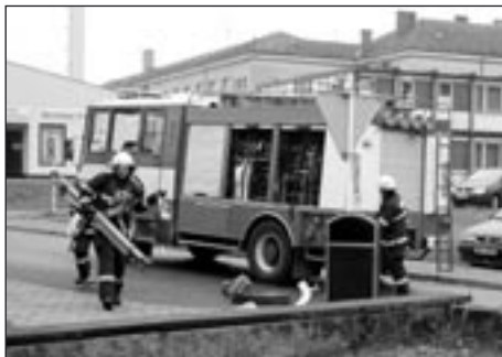
První jednotka dorazila k požáru za 4 minuty

Jeden pokoj však byl z chodby nepřístupný a tak musela být povolána vysokozdvíhací plošina