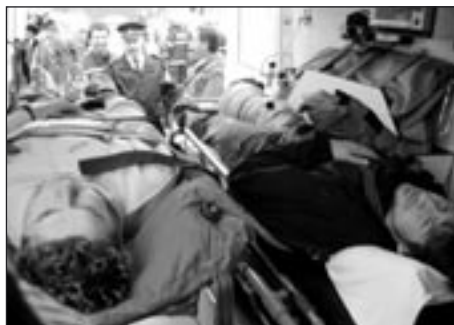
Poslední zranění jsou po ošetření naloženi do sanitky