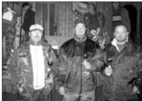
Na snímku vítězové závodu Pohár Poličský candát – viz výsledky