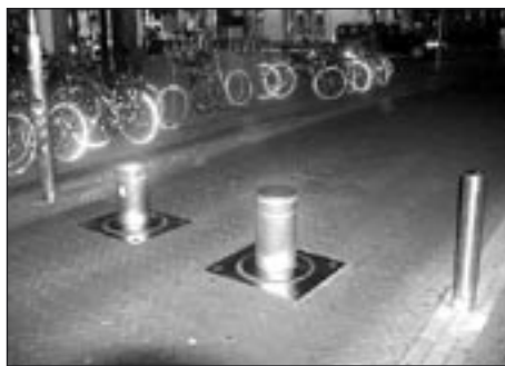
Zasouvací zábrany vjezdu - v noci osvětlené

V Heusdenu (Niz.) rekonstruovali v posledních letech vodní bašty tak, aby byly co nejbliže stavu,