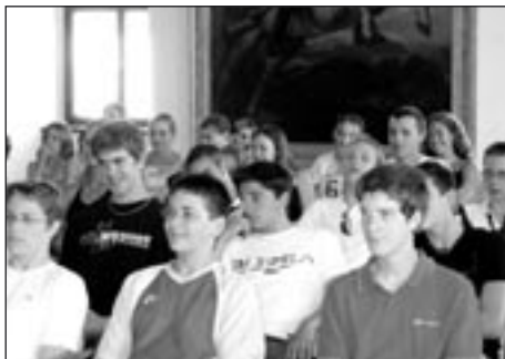
Francouzští studenti byli přijati v prostorách poličské barokní radnice.