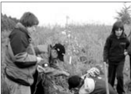
Žáci Speciální ZŠ sází svoji vrbu

A právě tady se nám nalepila na paty smůla v podobě zdravotních problémů tří hráček a my jsme musely odehrát první turnaj v oslabené sestavě. Toho využilo dokonale družstvo Dolního Újezda a my jsme odjížděly s prohrou 0 : 3.