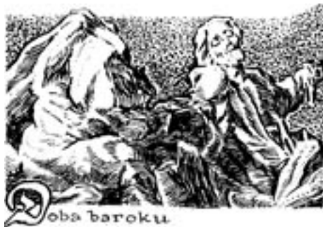
Noli me tangere! Kresba: PhDr. O. A. Kukla

Ze starších prospektů a propagačních brožur, věnovaných místním památkám, se dovídáme, že tu jde o jediná dvě zachovaná zastavení ze zničené Křížové cesty, která obepínala obvod chrámu, a za požáru r. 1845 ji pohltily plameny. Podle jedné z nich mělo jít o 4. a 13. zastavení, jiní pokládali dialog dvou postav za součást 12. zastavení (Jan a Maria pod křížem: Cupal).