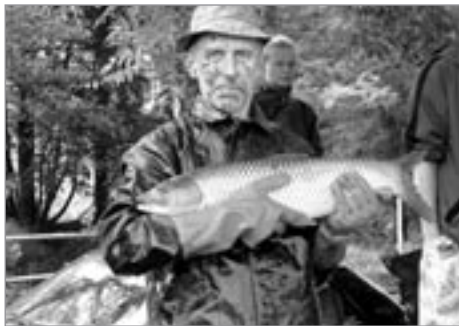
K největším vyloveným rybám patřil i tento amur.