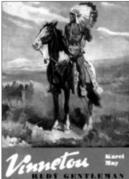
Ilustrace Zd. Burian

Nakonec přivedl mezi usmířené Indiány křesťanské misionáře, vyzval lid, aby pozorně naslouchal jejich slovům a varoval je před novými rozbroji. Tím skončilo Hiawathovo poslání mezi svobodnými lovci v prériích, rozloučil se s bojov-