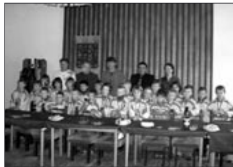
Krajské přeborníky přijalo vedení města