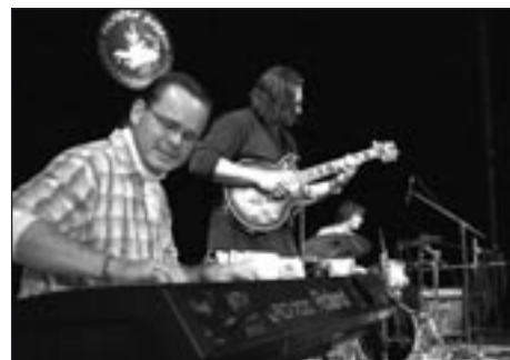
Své místo na českém jazzovém slunci si dobývá skupina Jazz Efferter