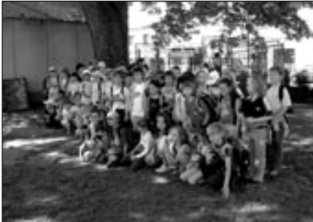
Všichni startující v turnaji v přehazované

V pondělí 25. 6. se uskutečnil turnaj v přehazované, kterého se zúčastnilo 12 družstev (žáci a žákyně druhých tříd Masarykovy ZŠ). Nejmenší naděje svedly vyrovnané boje, i když někteří hráli přehazovanou poprvé.