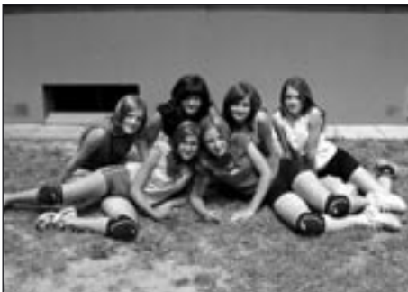
Vítězné družstvo ml. žákyň

26. 6. proběhl již VIII. ročník turnaje mládeže pro žáky a žákyně 6.-9. tříd. Letos startovalo 7 družstev (2 děvčátka, 2 chlapecká a 3 smíšená). Mladší žákyně poličského Spartaku si herně poradily se všemi družstvy a zvítězily. Jejich B tým skončil na 3. místě, mezi ně se vklínilo smíšené družstvo ze ZŠ Na Lukách.